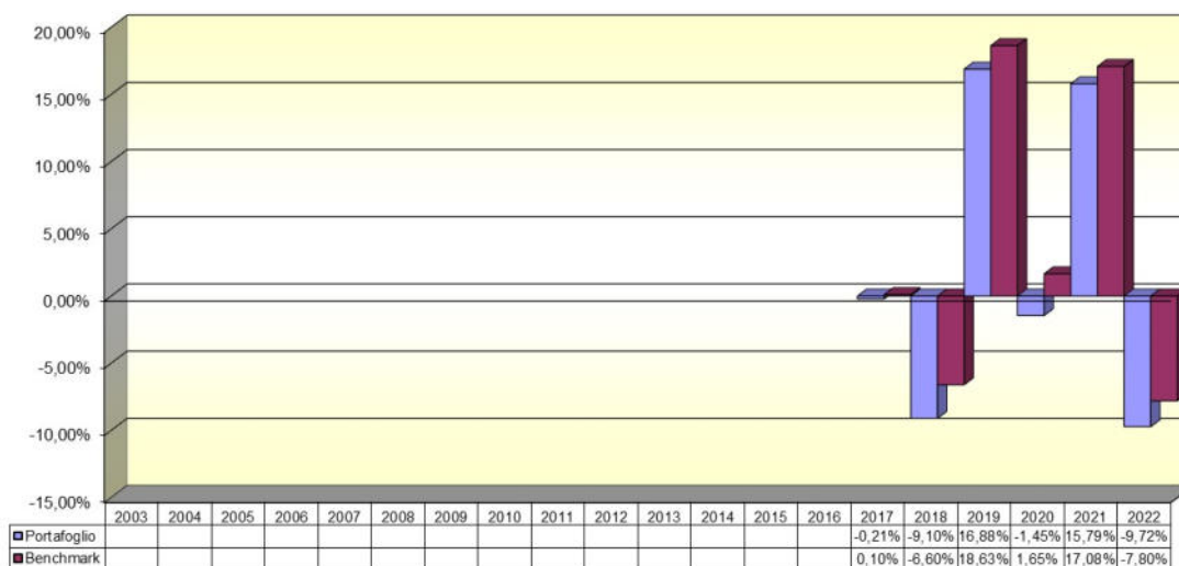
Tav. 4 – Rendimenti netti annui (valori percentuali)